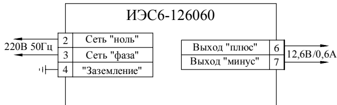
Рис. 2 Схема подключения

Примечание. После транспортирования источника при температуре ниже 10° С перед его включением необходима выдержка в нормальных климатических условиях не менее 6 часов.