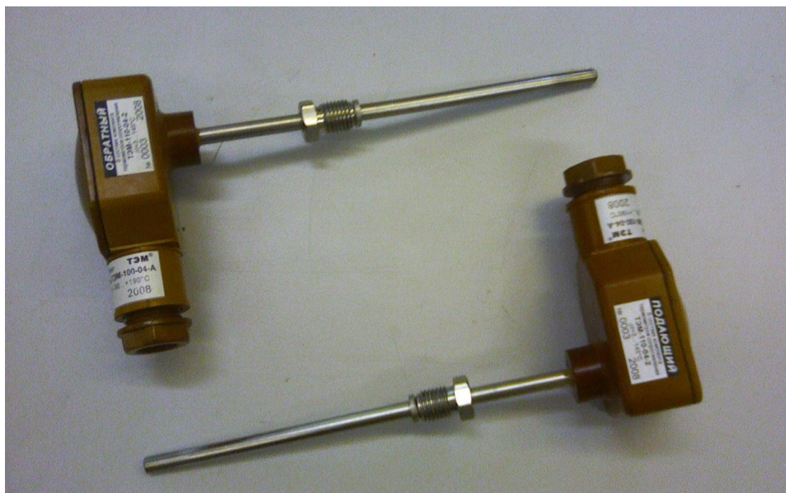
Рисунок 1 - Общий вид комплекта

Общий вид комплекта ТЭМ-110 представлен на рисунке 1.