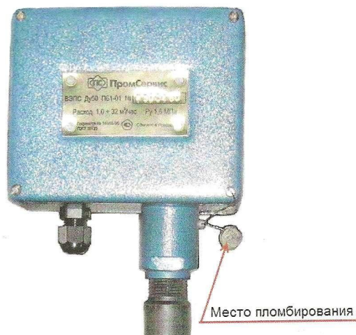
Рисунок 3 – Место пломбирования ВЭПС с УФС в стальном корпусе

В целях предотвращения несанкционированного доступа к узлам регулировки и настройки предусмотрены места пломбирования, указанные на рисунках 3 и 4.