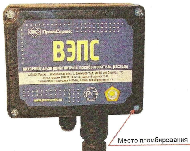
Рисунок 4 – Место пломбирования ВЭПС с УФС в пластиковом корпусе