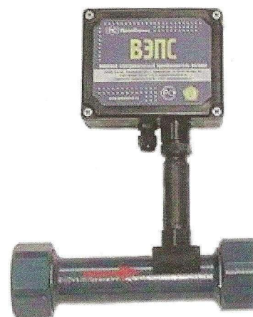
Рисунок 2 – Внешний вид ВЭПС с УФС в пластиковом корпусе

В целях предотвращения несанкционированного доступа к узлам регулировки и настройки предусмотрены места пломбирования, указанные на рисунках 3 и 4.