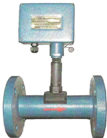
Рисунок 1 – Внешний вид ВЭПС с УФС в стальном корпусе

Внешний вид преобразователей расходов вихревых электромагнитных ВЭПС приведен на рисунках 1 и 2.