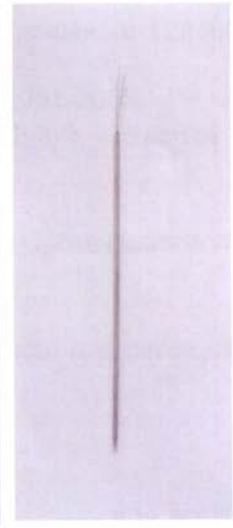
Вставка термо- метрическая для ТМТ-12