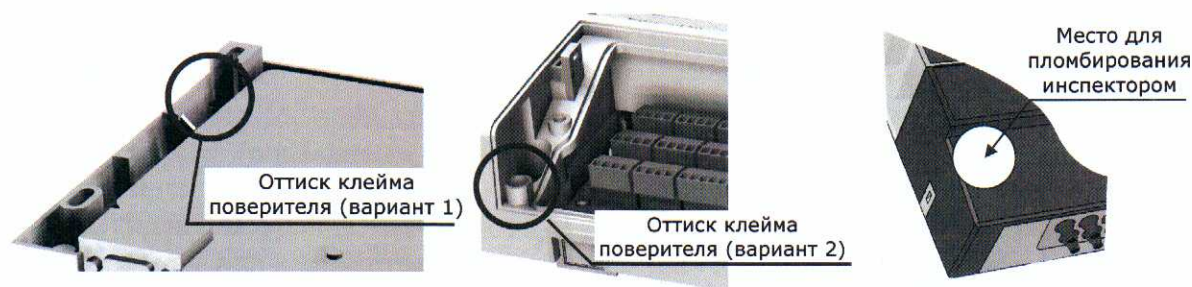
Рисунок 3 – Места пломбирования тепловычислителя